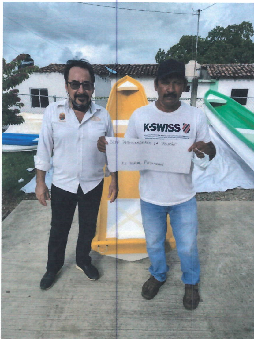
Entrega de Equipos (Cayucos) a pescadores Tonalá, Arriaga, Pijijiapan, Mapastepec, Villa Corzo, El Parral, Mezcalapa, Ostuacan, Socoltenango y Catazaja