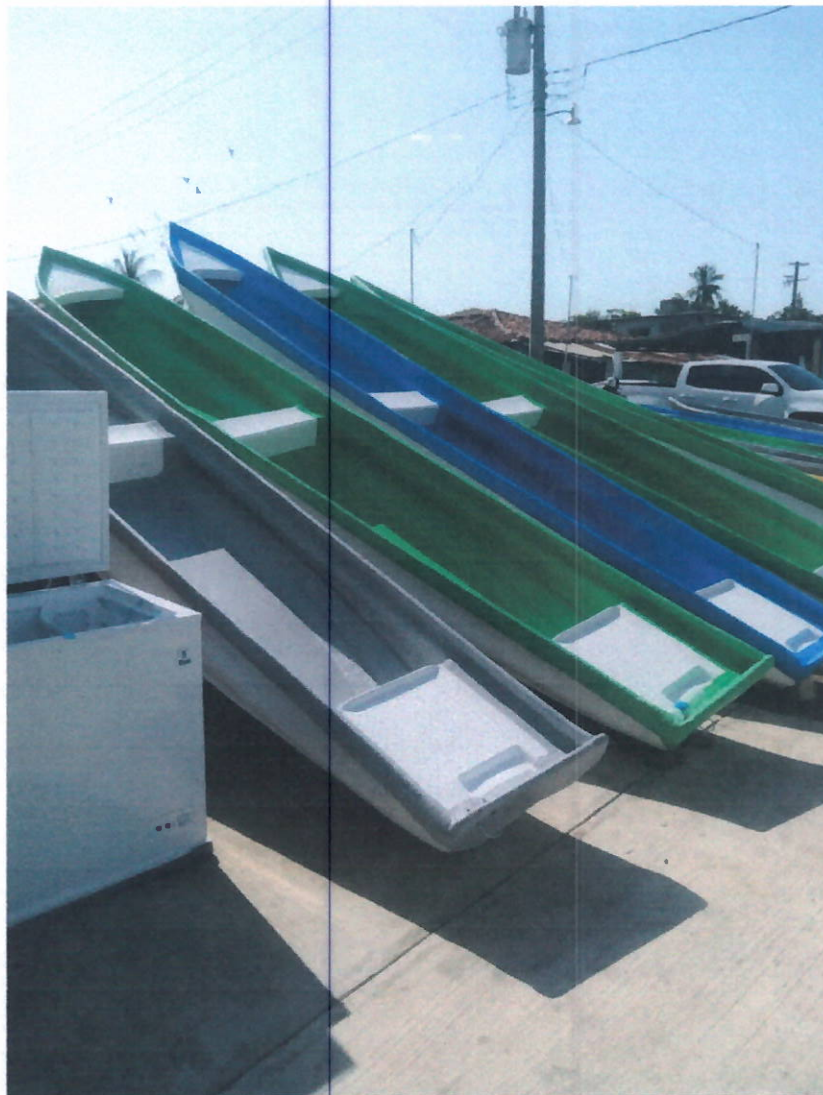
Entrega de Equipos (Cayucos) a pescadores

Este proyecto es de carácter público, no es patrocinado ni promovido por partido político alguno. Quien haga uso indebido de los recursos de este proyecto, deberá ser denunciado y sancionado de acuerdo con la ley aplicable y ante la autoridad competente.