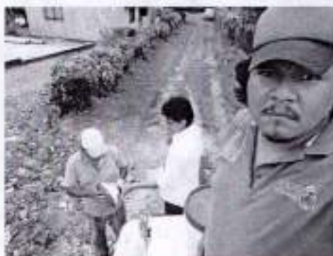
CACAHOATAN Y LOCALIDAD AHUACATLAN