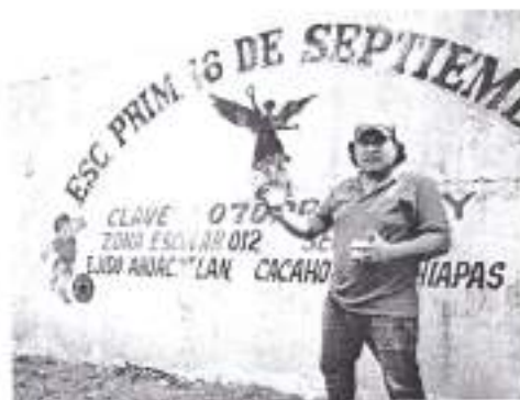
CACAHOATAN Y LOCALIDAD AHUACATLAN