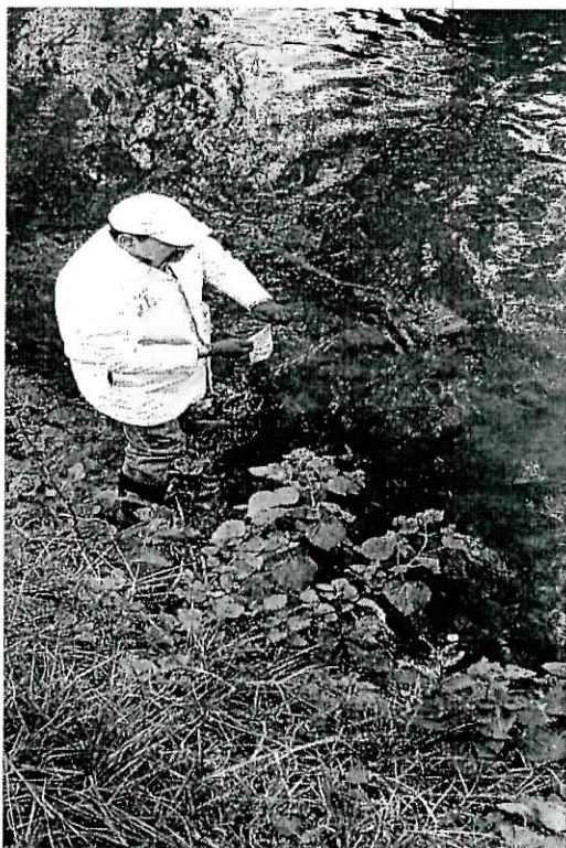
TOMA DE MUESTRA EN SITIO DENOMINADO ANTES DEL RASTRO