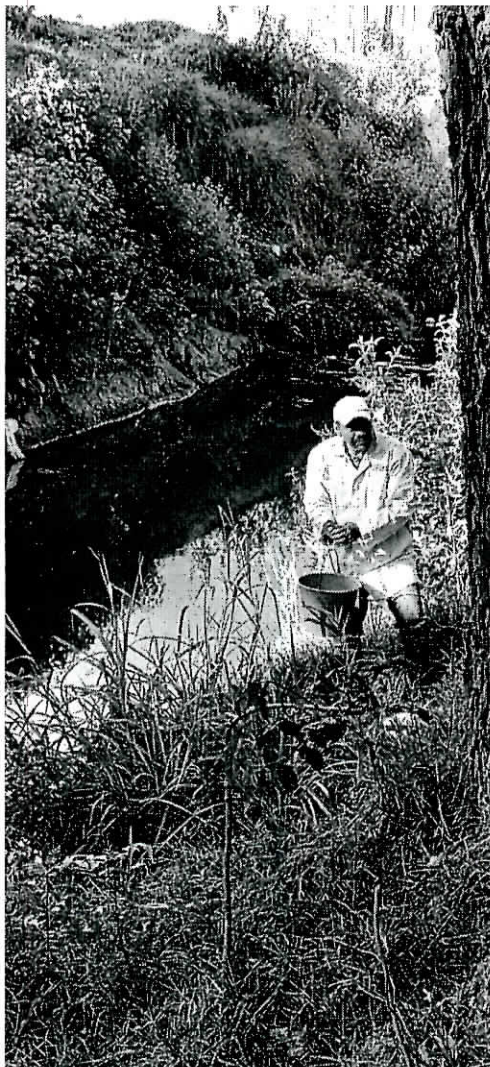
TOMA DE MUESTRA EN EL SITIO DENOMINADO SEDEM

"2023, Año de Francisco Villa, el Revolucionario del Pueblo"