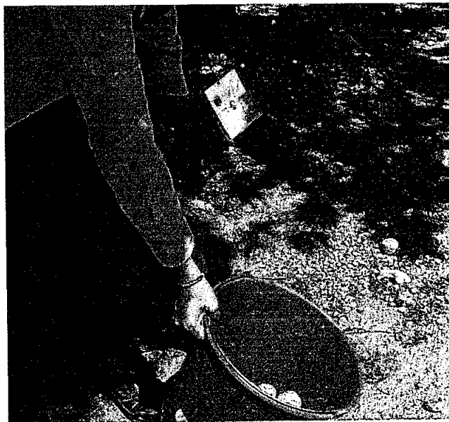
Recolecta de guayaba ( Psidium guajava )