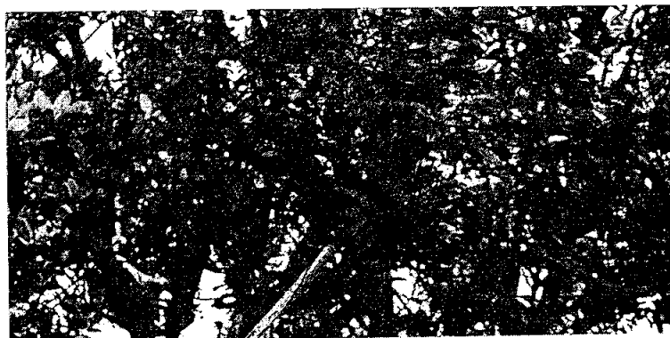
Recolecta de pimienta ( Pimenta dioica )