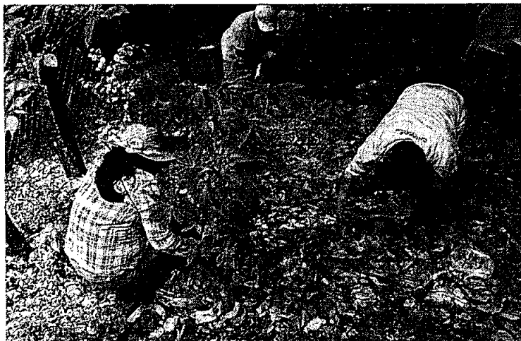
Recolecta de jobo ( Spondias mombin )