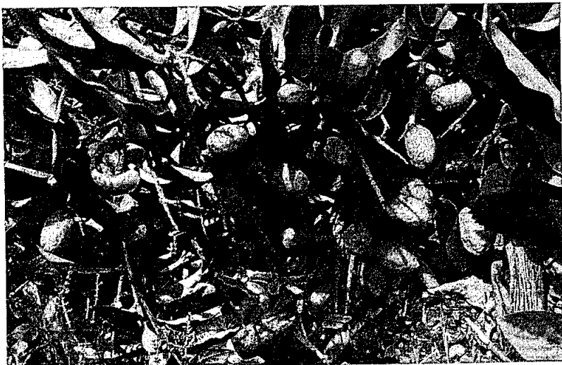
Frutos de usupio ( Couepia polyandra )