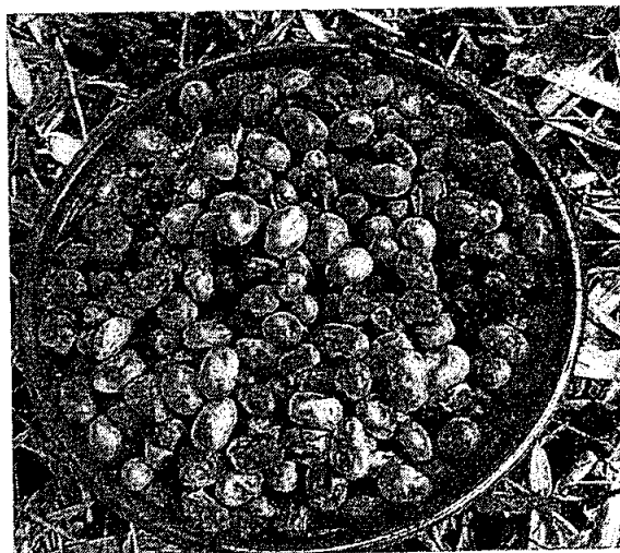
Colecta de jobo ( Spondias mombin )