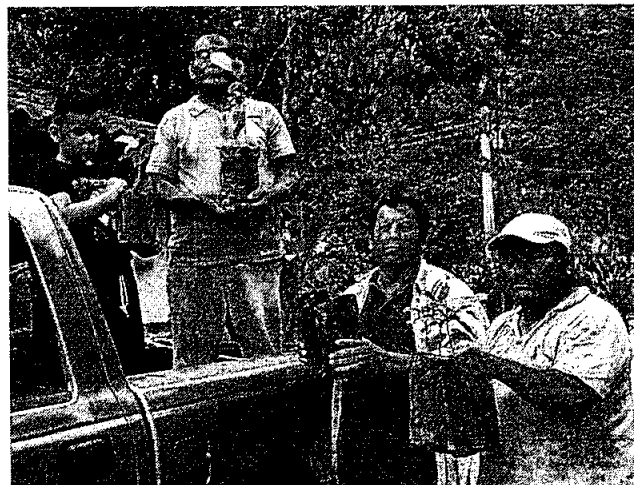
Entrega de plantas de usupio ( Couepia polyandra ) y pimienta ( Pimenta dioica ).