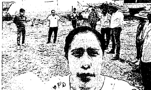
Reunión de trabajo en Instituto Tecnológico de México, sede Comitán de Domíquez