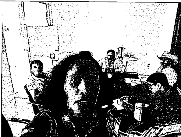
Reunión de trabajo en Orquidario y Jardín Botánico de Comitán de Domíquez