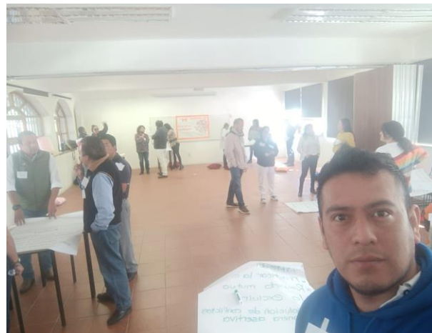
Presentación del violentometro 08 de marzo de 2024 “día internacional de la mujer”.