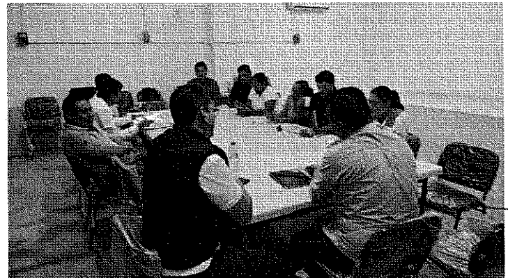
IMAGEN 2: Apertura del foro para opiniones y comentarios sobre el PMDU